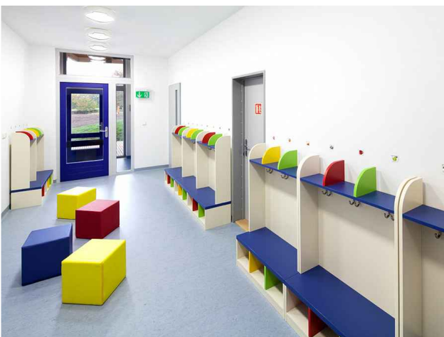
PŘÍKLAD VYBAVENÍ DĚTSKÉ ŠATNY

netypické tvary stolů ze dvou kusů, které lze seskupovat a rozdělovat podle potřeby