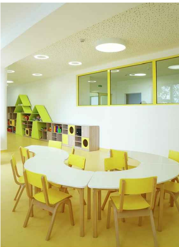
PŘÍKLAD BAREVNÉHO ŘEŠENÍ TŘÍDY MŠ

barva sedáků a opěradel židliček ladí s barvou podlahy