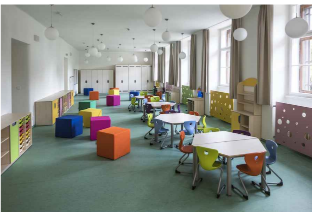
PŘÍKLAD VYBAVENÍ TŘÍDY MŠ

barva sedáků a opěradel židliček ladí s barvou podlahy