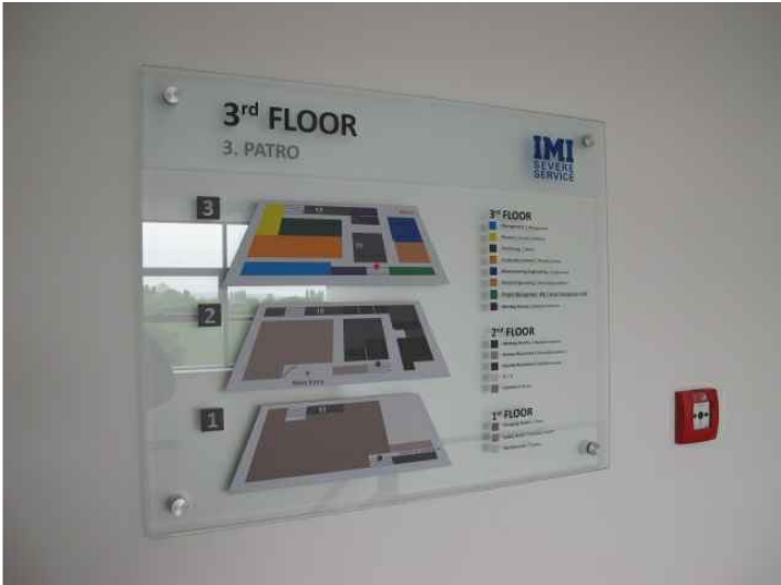
OS 01, OS 02, OS 03