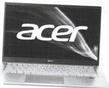
Acer Swift 3 (SF314-511), stříbrná (NX.ABLEC.002)