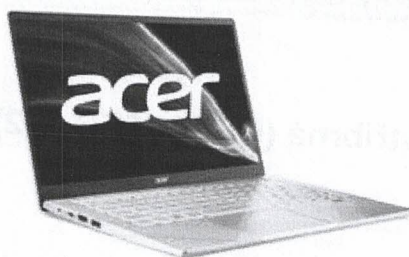
Acer Swift 3 (NX.AB1EC.003)