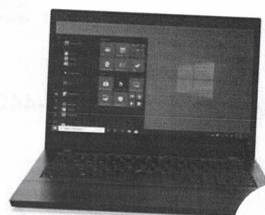
Lenovo ThinkPad L14 Ge černá (20U2S6SV00)