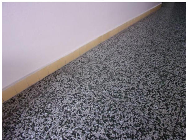
příloha 1: Stávající stav.