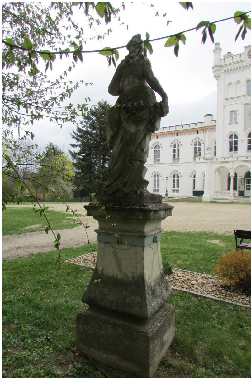
Celek současný stav, zadní pohled