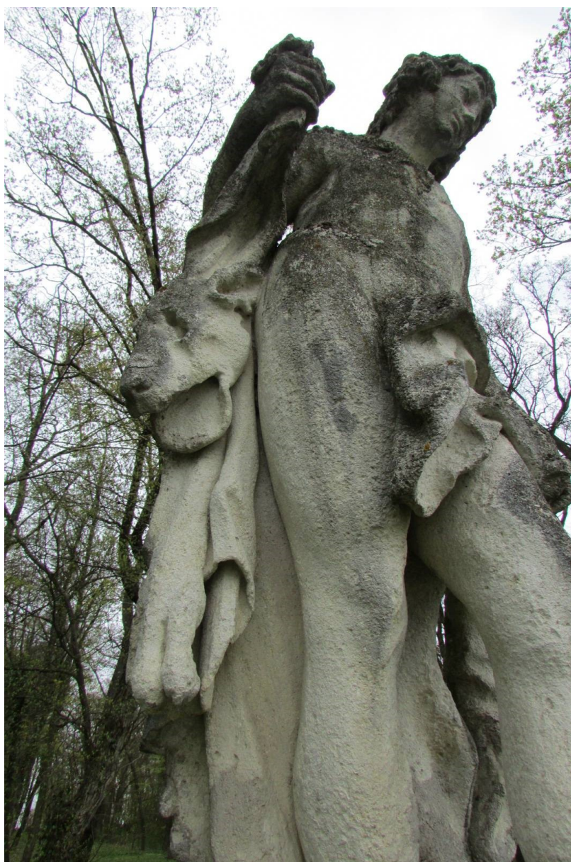
Ukázka biologického napadení sochy