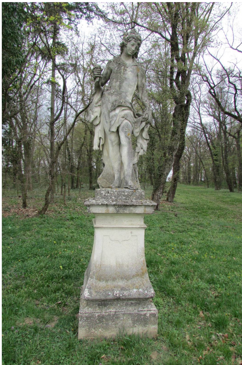
Celek současný stav, čelní pohled