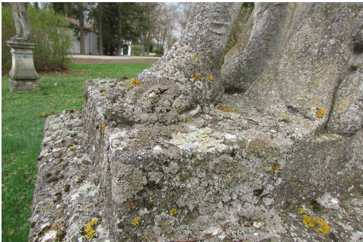
Biologické vrstvy ve spodní části sochy