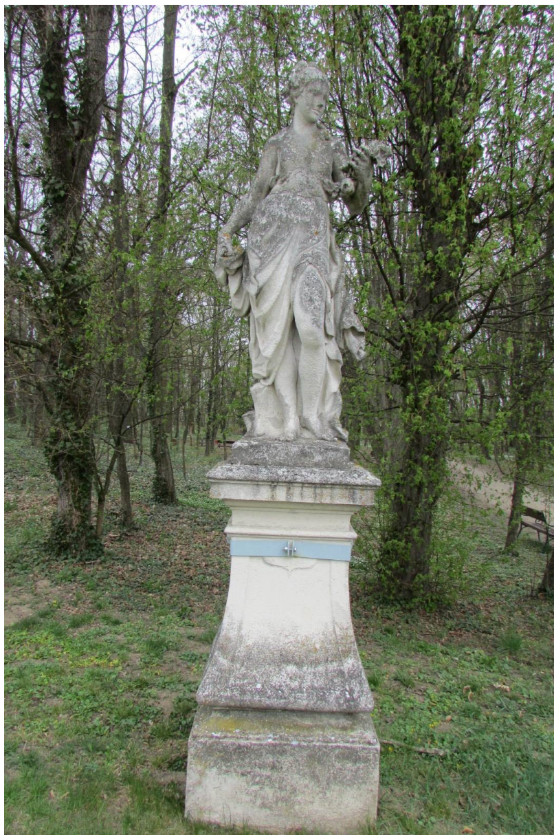
Celek současný stav, čelní pohled