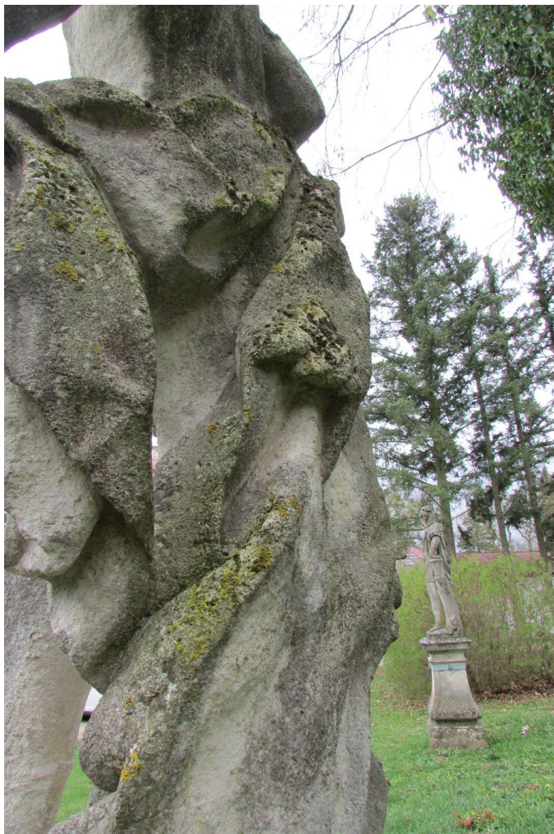
Ukázka degradace kamene v zadních partiích sochy