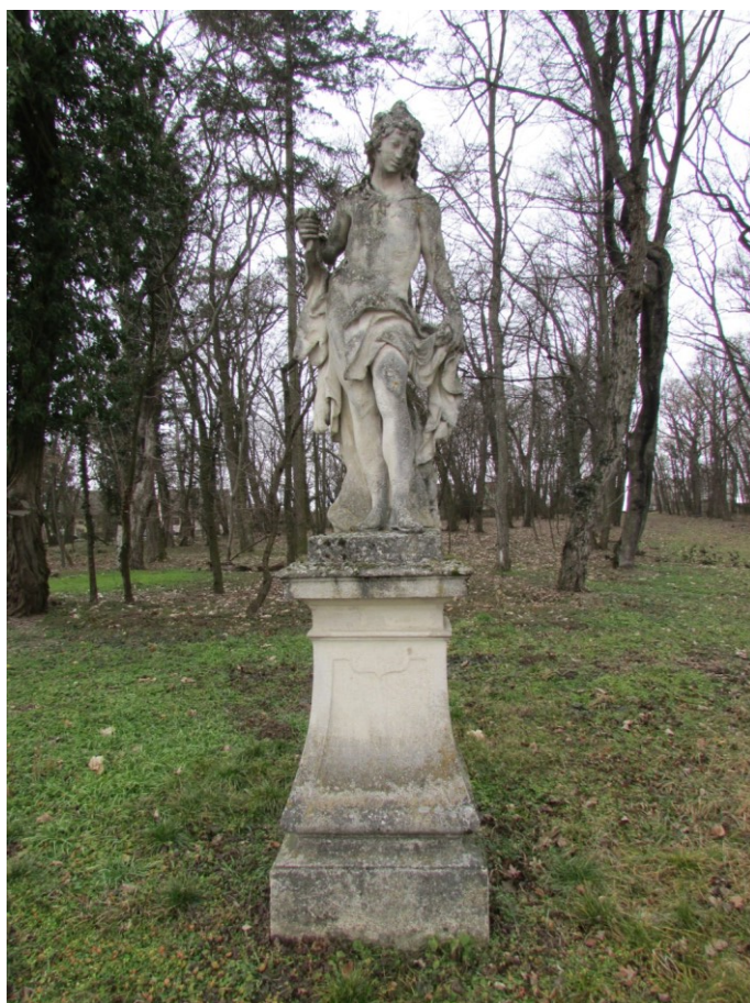
Socha Herkula (Herákles)

Sochařská výzdoba zámecké zahrady Nového Zámku v Jevišovicích