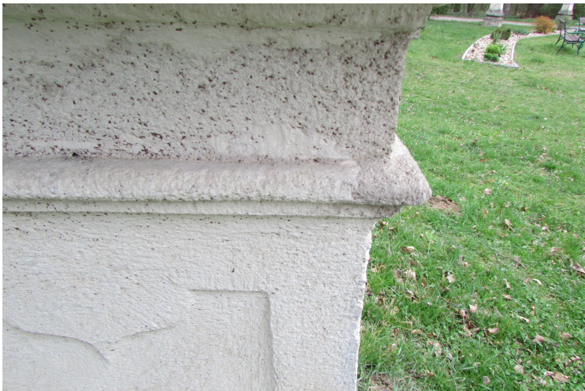
Detail tmelů z předešlé rekonstrukce