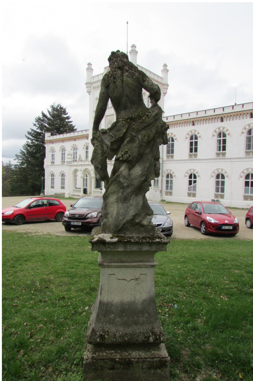
Celek současný stav, zadní pohled