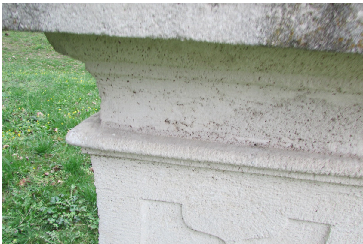
Detail tmelů z předešlé rekonstrukce