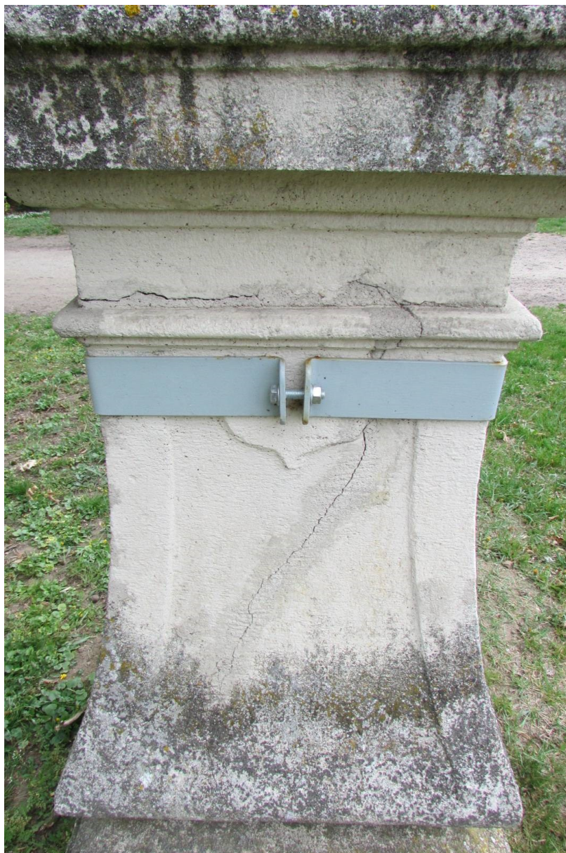
Provizorní sanace praskliny podstavce