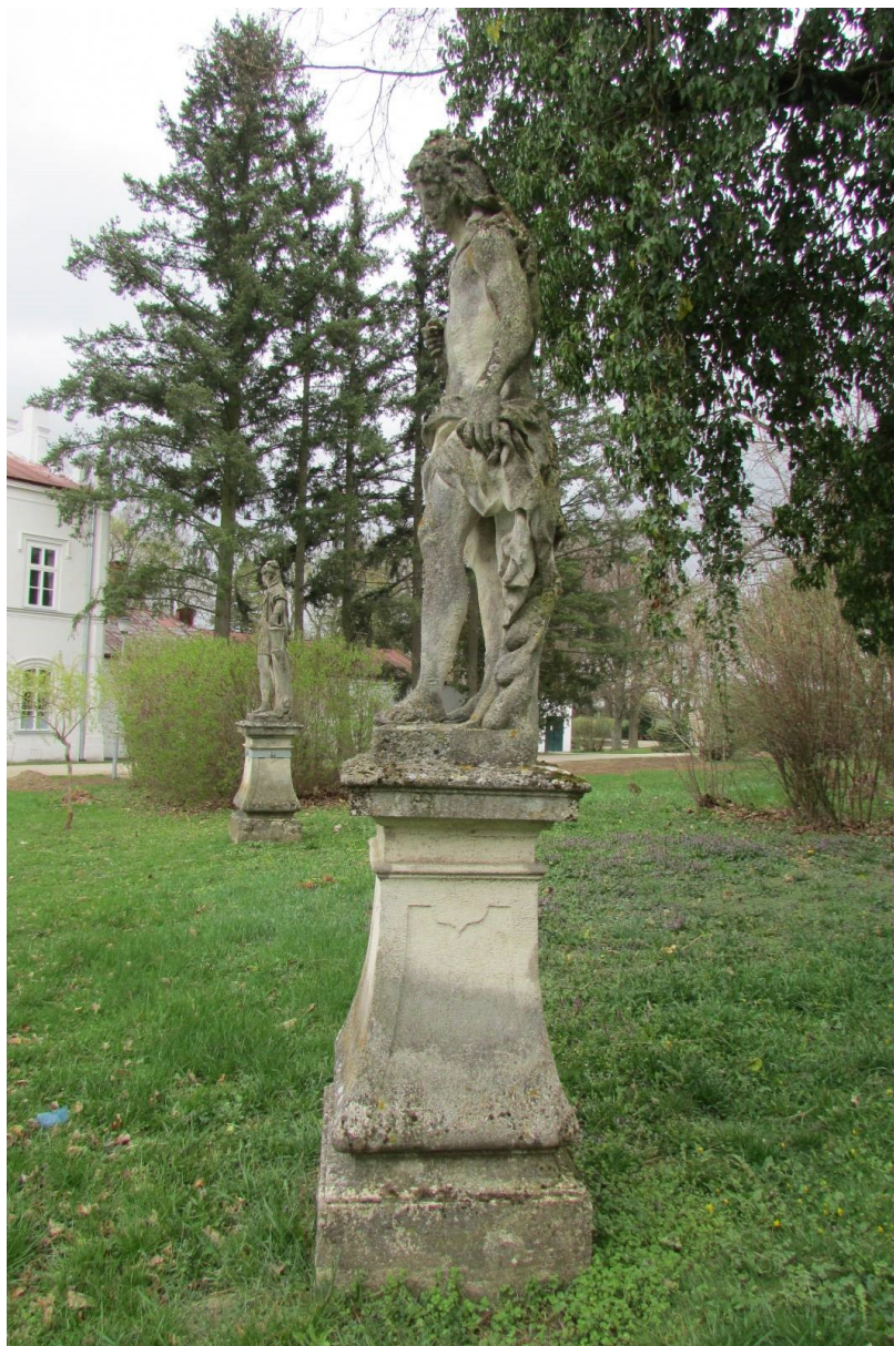
Celek současný stav, levá strana