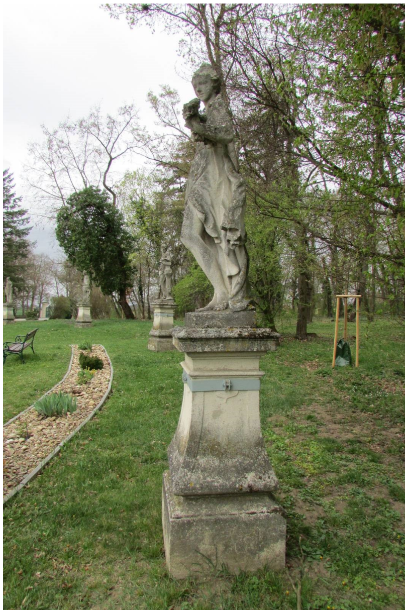
Celek současný stav, levá strana