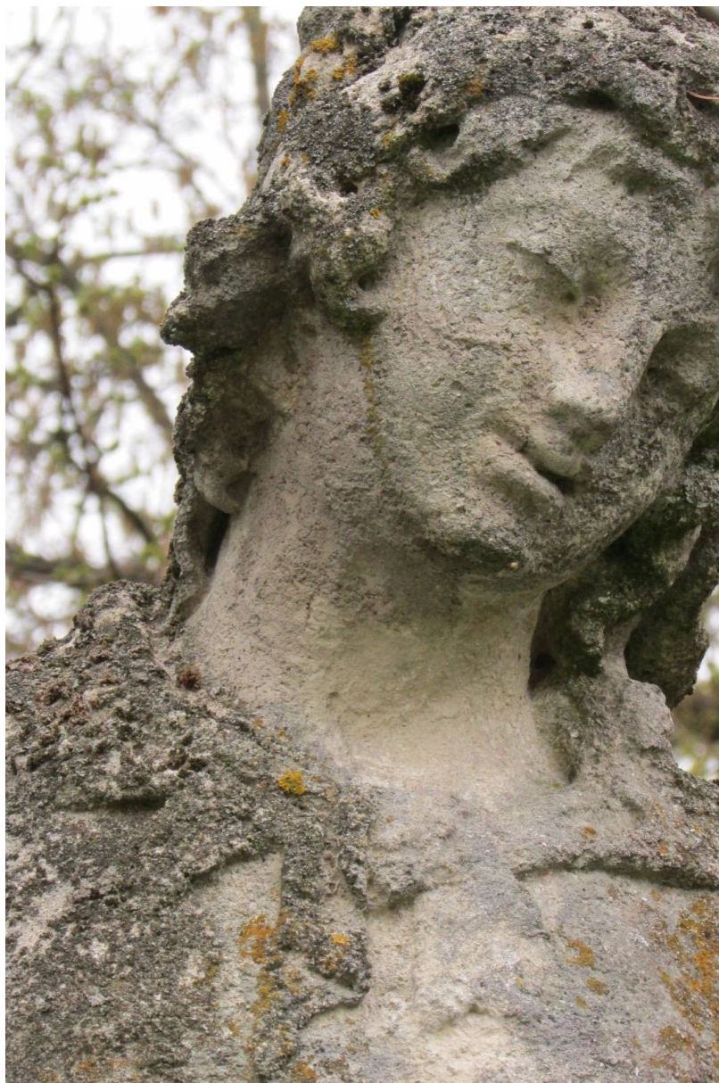
Hlava, detail degradace povrchu kamene