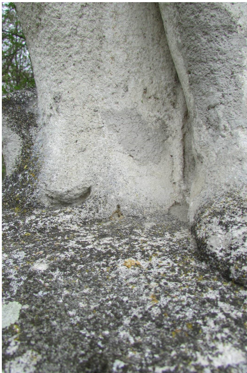
Detail degradace kamene