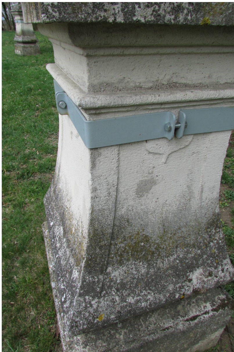
Provizorní sanace praskliny podstavce