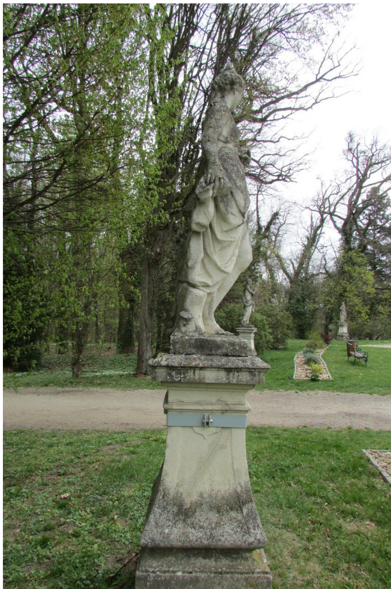
Celek současný stav, pravá strana