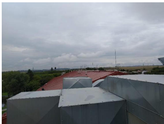
Obrázek 1 Půdorys dle katastru a fotodokumentace objektu a jeho střechy pro umístění FV elektrárny