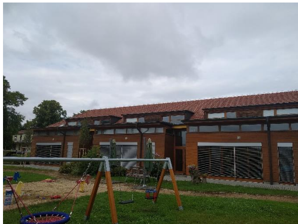
Obrázek 1 Půdorys dle katastru a fotodokumentace střechy objektu pro umístění FV elektrárny