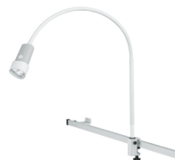
N30-1 P SH