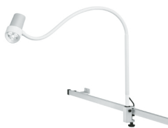
N30-1 P SV