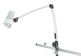
N30-1 P F1