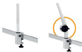
Rameno bez nebo s aretačním kloubem