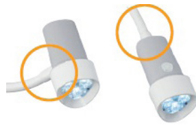
Příčné nebo přímé napojení hlavy svítidla