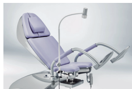
* Svítidlo HALUX N30-1 P SGV GYN s aretací vč. držáku s brzdou na eurolištu