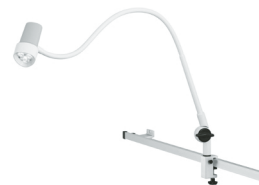
N30-1 P SGV N30-1 P SGV GYN