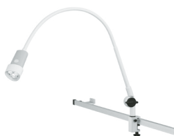
N30-1 P SGH