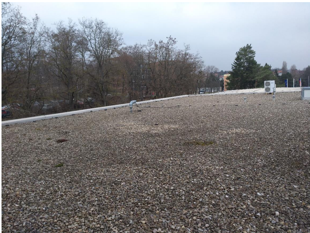
Objekt S002 – 3 spojovací koridor a střecha nad recepcí se světlíky