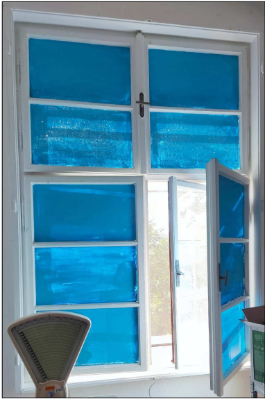
POHLED ZE VNITŘÍ