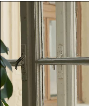
KLIČKY A PROFILACE KŘÍDEL