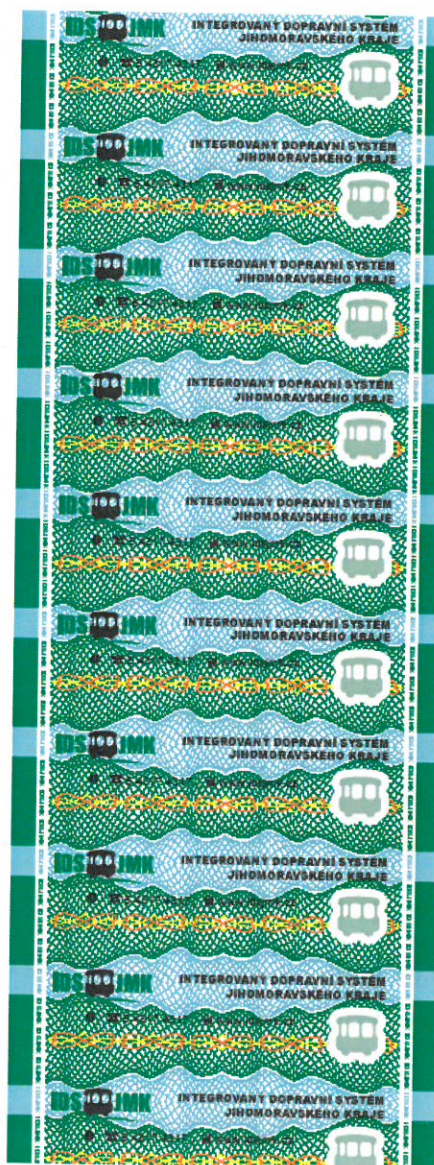
rubová strana role