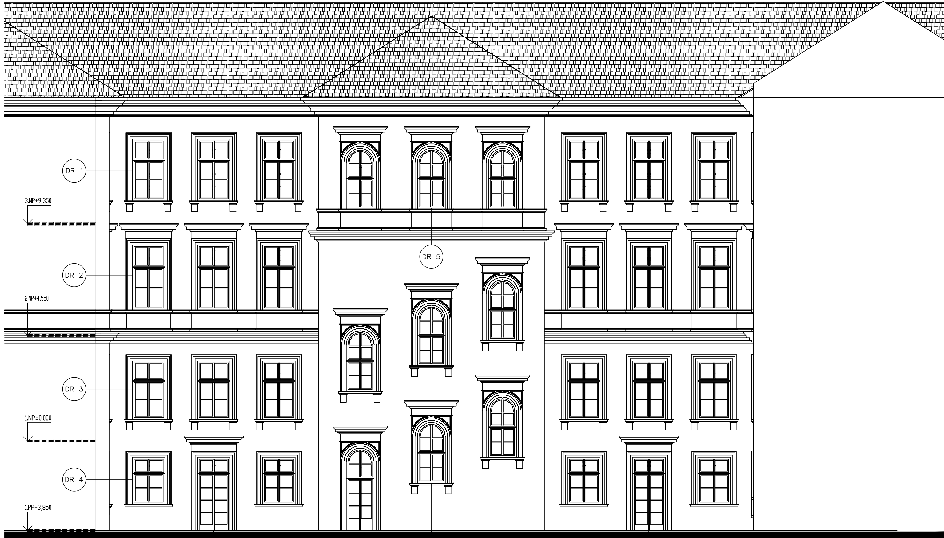
FASÁDA – NÁDVORÍ JIŽNÍ m.ř. 1:100