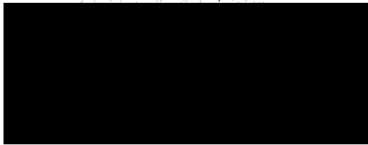
FIRESTA-Fišer, rekonstrukce, stavby a.s.