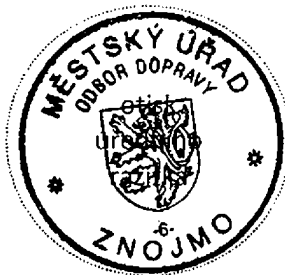
Bc. Ivana ZÍTKOVÁ

Stavba nesmí být zahájena, dokud stavební povolení nenabude právní moci. Stavební povolení pozbývá platnosti, jestliže stavba nebyla zahájena do 2 let ode dne, kdy nabylo právní moci.