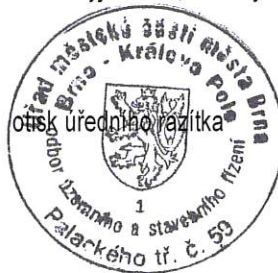
JUDr. Ivona Černá vedoucí OÚSR ÚMČ Brno - Královo Pole

Pokud se budete k výše uvedenému záměru písemně vyjadřovat, uvádějte prosím na všech písemnostech naše číslo jednací.