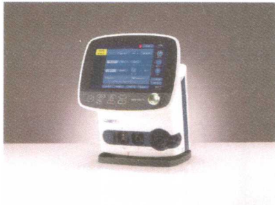
Plicní ventilátor HAMILTON C3