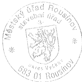
Bc. Hana Horčíčková vedoucí odboru stavebního úřadu

Stavba, podle projektové dokumentace určené k řízení o změně stavby před dokončením nesmí být zahájena, dokud rozhodnutí nenabude právní moci.