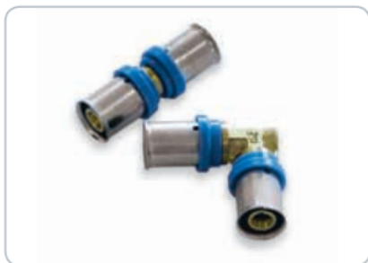
Tvarovky z mosazi

Tvarovky jsou vyrobeny z korozivzdorné mosazi.