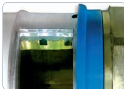
Řez lisovaným spojem

Tvarovky Vám zaručují nejvyšší záruku při jednoduchém zpracování.