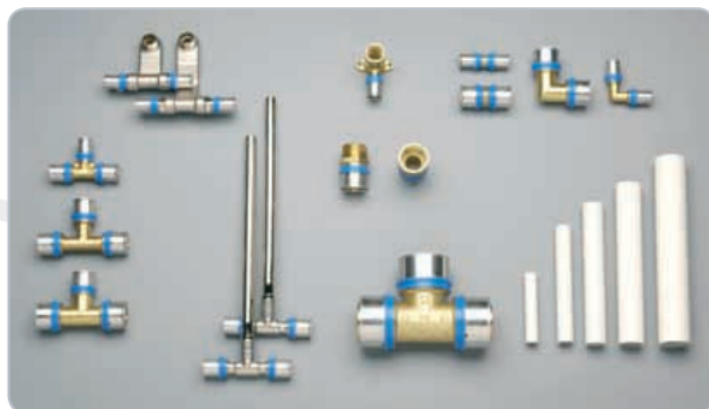
Nejčastěji používané tvarovky z mosazi