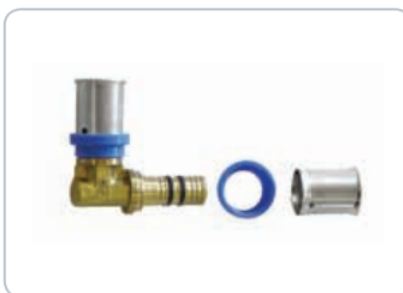
Jednotlivé části tvarovek