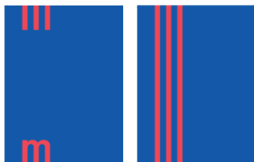
přední a zadní strana