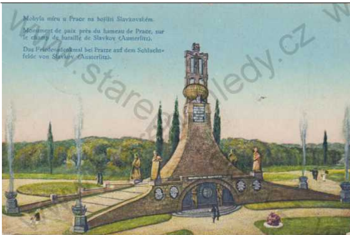
Historická pohlednice, na níž je zřejmé materiálové rozlišení úpravy cest

Zádveří/ foyer pro čekající návštěvníky v době nepříznivých povětrnostních podmínek je řešeno vloženou skleněnou předstěnou , komplementární k návrhu Mohyly míru architekta Josefa Fanty ze začátku 20. století, plní několik funkcí: vytváří hodnotné zádveří hlavního vstupu do památníku a z čelních pohledů – kdekoli od Mohyly - bude vidět, jak se v této skleněné předstěně Mohyla zrcadí.