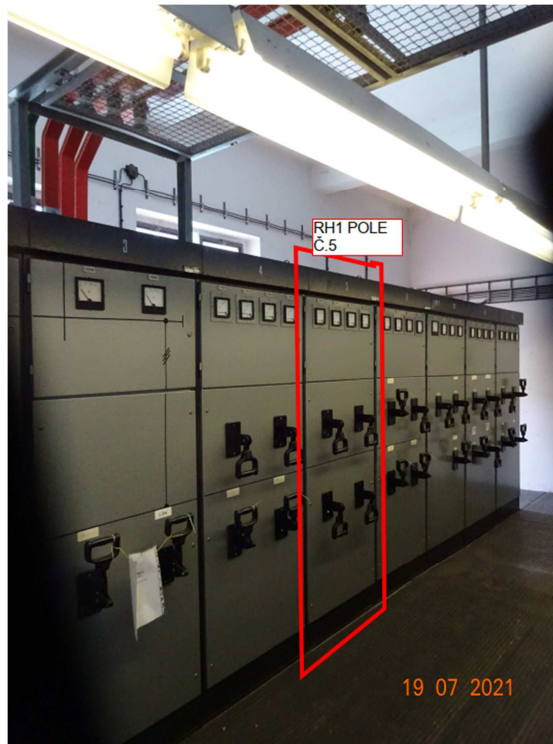
foto 2. . rozvodna nn trafostanice – stávající pole č.5 rozvaděče RH1M, výzbroj

foto 1.- rozvodna nn trafostanice umístění rozvaděče RH1 pole č.5