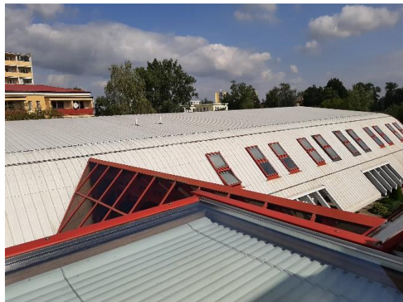
Obrázek 1 Půdorys dle katastru a fotodokumentace objektu a jeho střechy pro umístění FV elektrárny