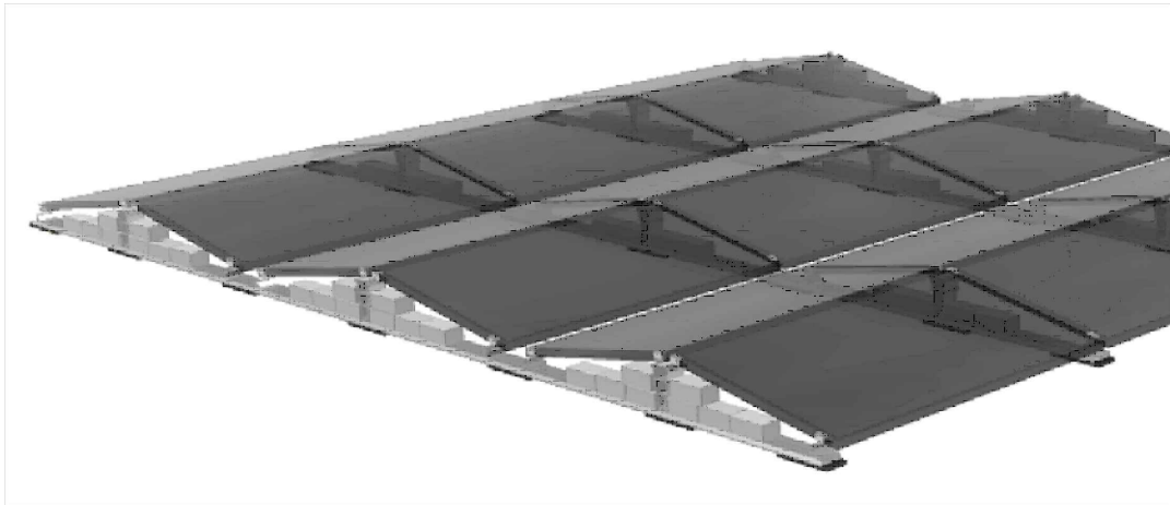
PŘITÍŽENÉ FV PANELY