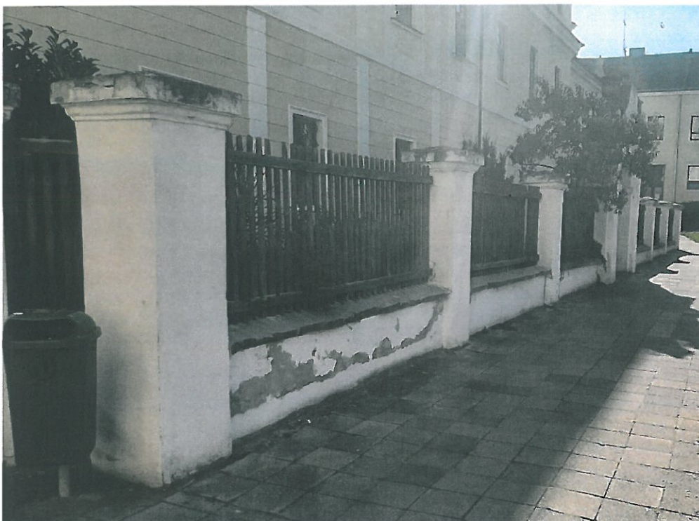
BOČNÍ POHLED S DEGRADACÍ OMÍTEK