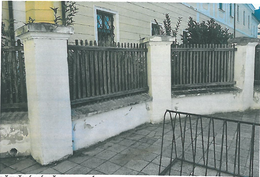
DŘEVĚNÁ VÝPLŇ OPLOCENÍ