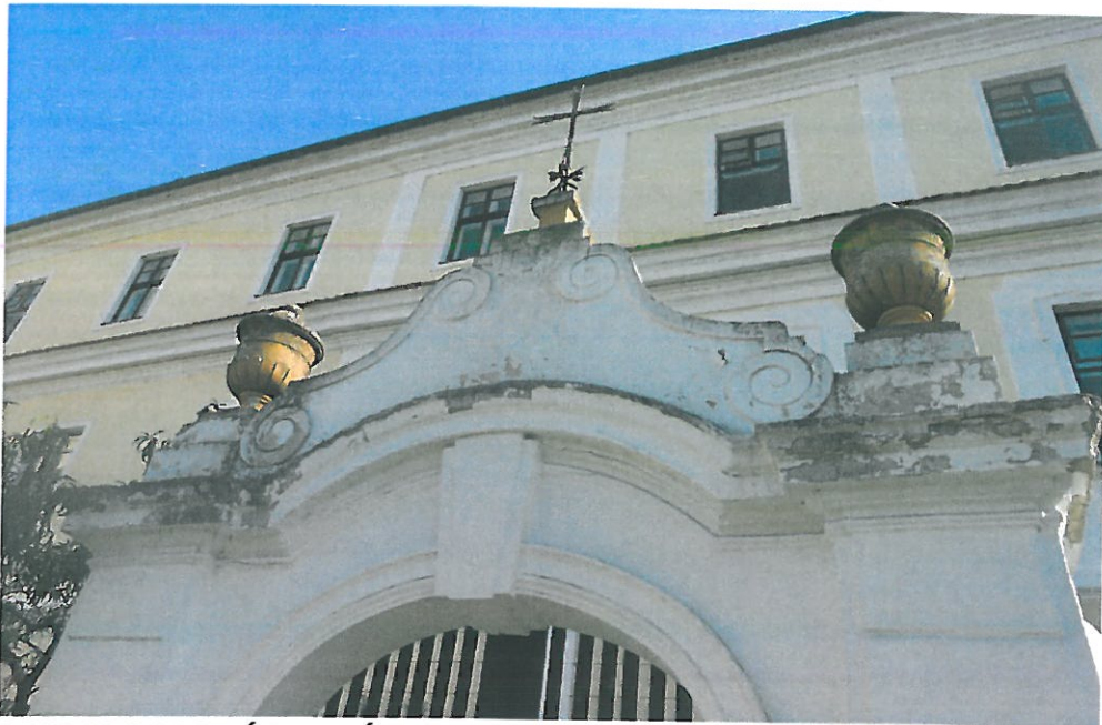
DEGRADACE OMÍTEK BRÁNY