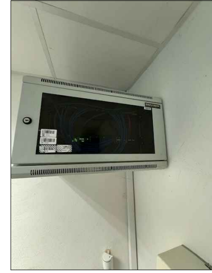
doplnění optické kazety