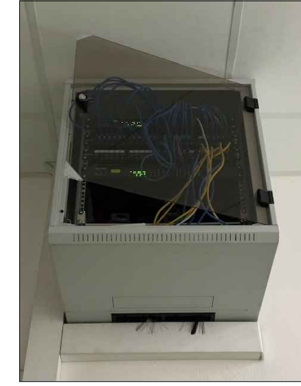
doplnění 19" optické vany