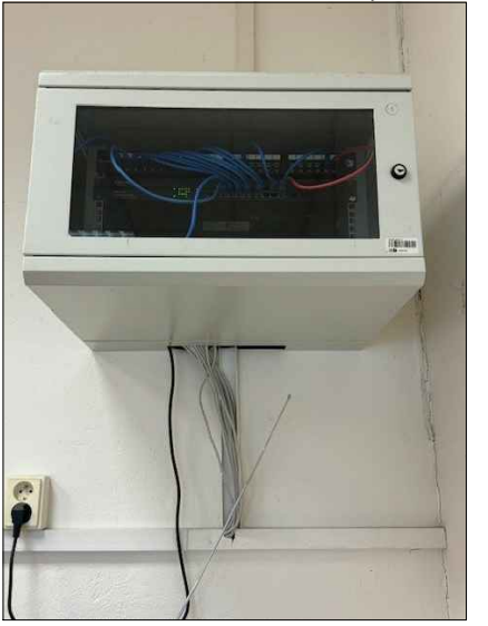
doplnění optické kazety