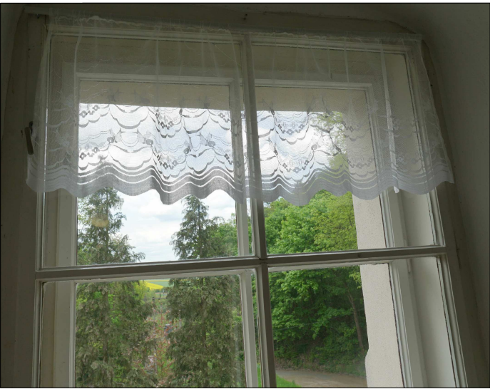
POHLED ZE VNITŘ