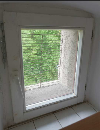
OKNO A-3-06 POHLED ZE VNITŘÍ