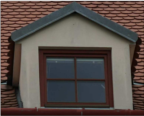
VIKÝŘ POHLED VNĚJŠÍ