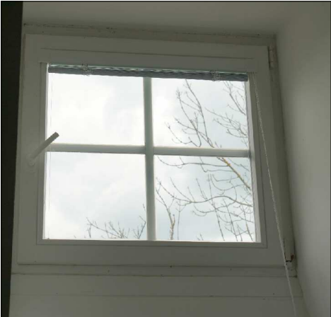
VIKÝŘ POHLED ZE VNITŘÍ