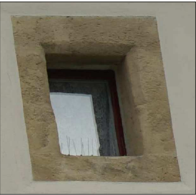
OKNO A-3-04 POHLED VNĚJŠÍ