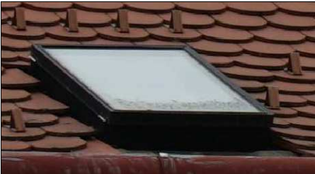
STŘEŠNÍ VÝLEZ PROSKLENÝ